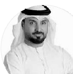
Мохаммед АльКафф Аль Хашми

Ключевая фигура Исламского банка Дубаи - первого полноценного финансового учреждения в мире, соответствующего нормам Шариата.