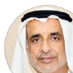
Хуссейн Мохаммед Аль Миза

Ключевая фигура Исламского банка Дубаи - первого полноценного финансового учреждения в мире, соответствующего нормам Шариата.